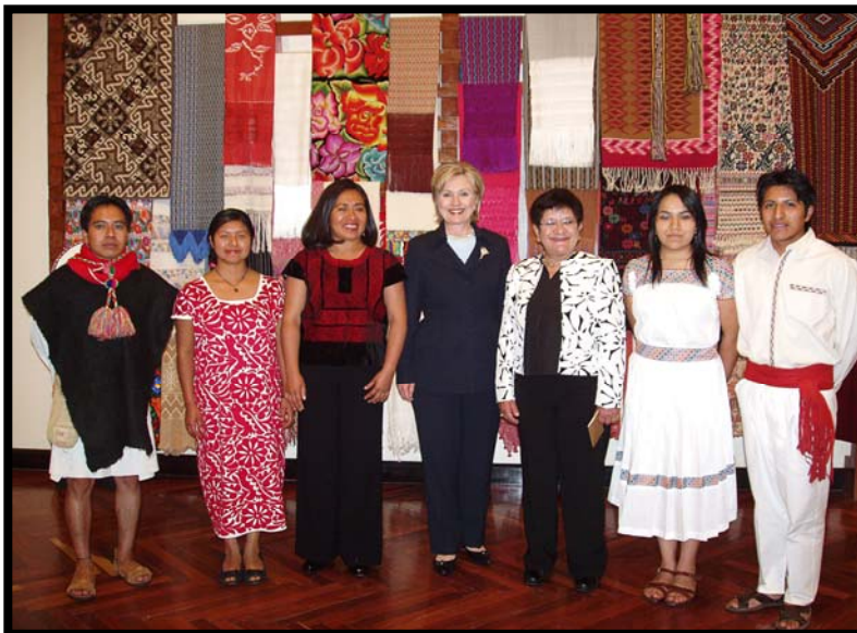
La Secretaria de Estado del Gobierno de Estados Unidos, Hillary Rodham Clinton con exbecarios