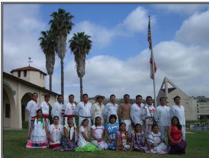
Profesores ciclo 2006-2007 en las instalaciones de CALPOLY

Dicha Universidad cuenta con un programa diseñado para maestros bilingües, es un programa especial que presta particular atención a las áreas de especialización de los candidatos y sus necesidades actuales y futuras. Todos los costos de estudio, alojamiento y comida están cubiertos por la beca.