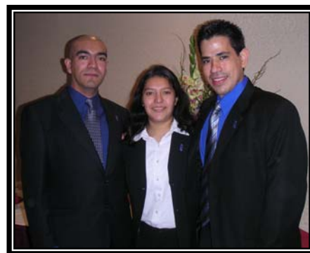
Jóvenes sordos generación 2004

El objetivo, es que los jóvenes puedan integrarse en áreas de empleo que incluyan manejo de computadoras en pequeñas y medianas empresas y/o instituciones públicas y privadas, bibliotecas, compañías editoriales, etc. Asimismo, le capacitará para un trabajo a nivel medio en sistemas de base de datos, tales como bancos.