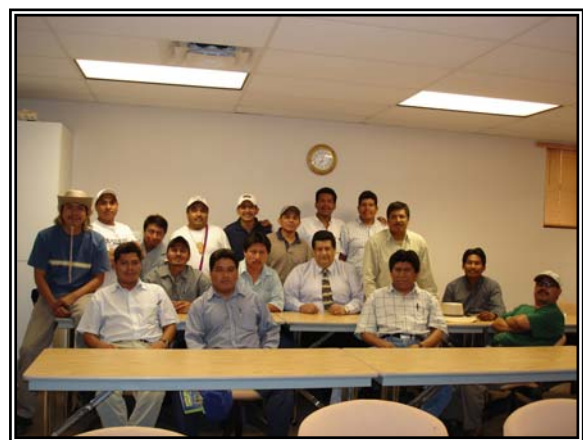
Profesores ciclo 2004-2005 (primera generación)